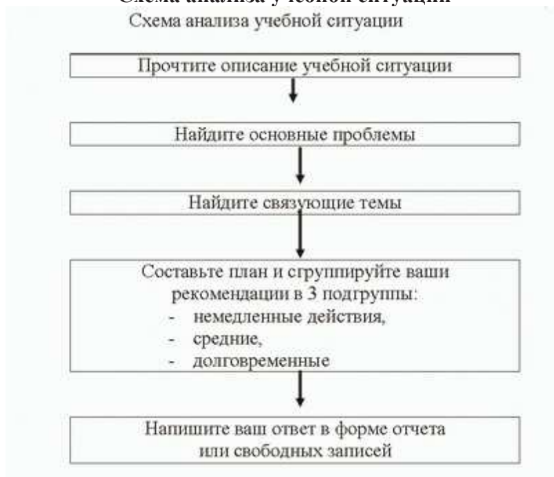
Схема анализа учебной ситуации

Шкала и критерии оценивания результата учебной ситуации, выполненной обучающимися, представлены в таблице